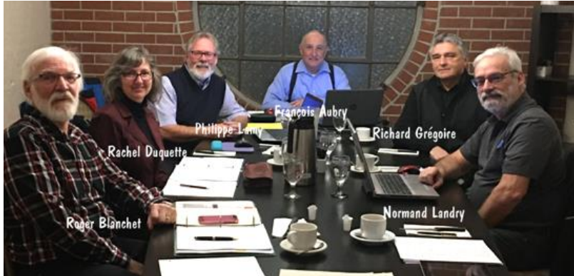
Photo du comité de direction lors de la réunion de février 2020