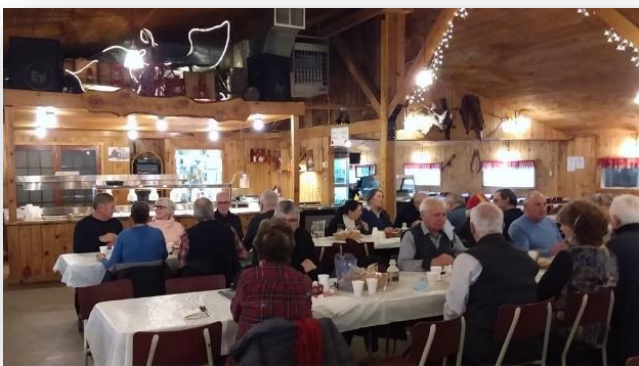
Cabane à sucre chez Besner à Coteau du Lac